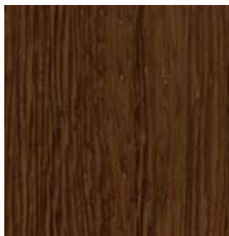
LATI CHOCOLATE - 86.009