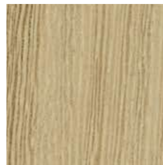
LATI BRERA - 86.023