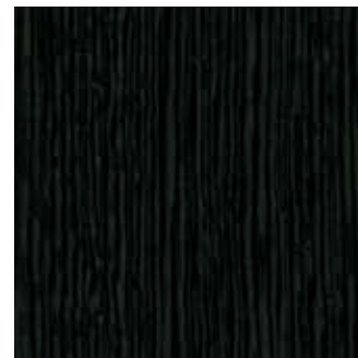
LATI BLACK - 86.051