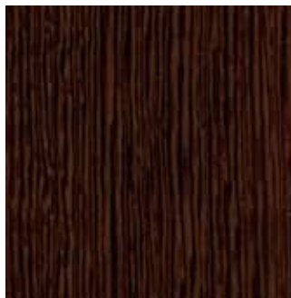
LATI MOKA - 86.029