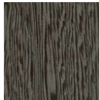
LATI PUDONG - 86.021