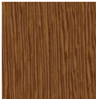
LATI CAMEL - 86.059