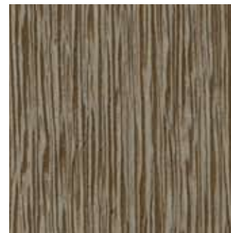
LATI SOHO - 86.027