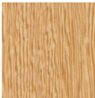
LATI MACCHIATO - 86.016